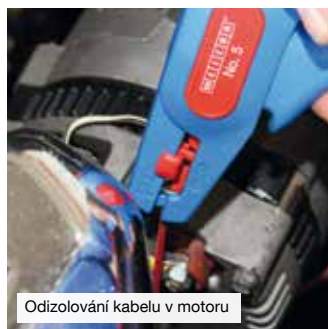
Odizolování kabelu v motoru