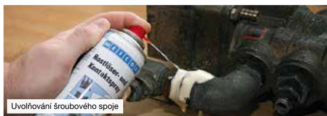
Uvolňování šroubového spoje