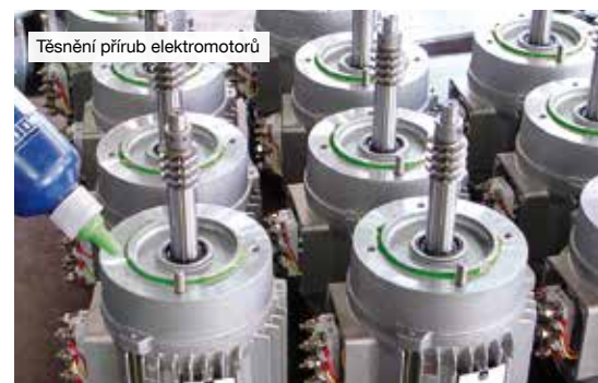
Těsnění přírub elektromotorů