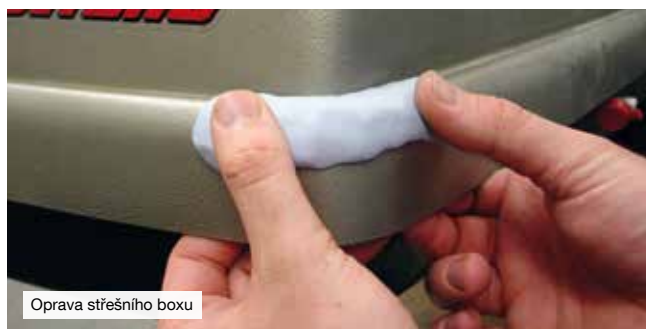
Oprava střešního boxu